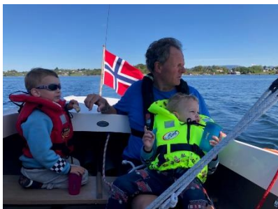
Nye og gamle seilere på tur i NOR142

Klassereglene presses av dansker og amerikanere. Danskene har flere seilmakere som finner på finurlige trimmeanordninger, og amerikanerne utvikler seil. Dette ble tatt opp på årets admiral møte i San Francisco. Danskene er behandlet, og det gjøres presiseringer i reglene for at ikke noe skal misforstås. Det er et sterkt ønske om å unngå for mange særordninger. Amerikanerne fikk anledning til å teste en ny type seilduk som er mye mer slitesterk. Det vil si at den strekkes ikke, selv med mye vind. Prisen er enn så lenge høy, det blir spennende å se utviklingen på dette.